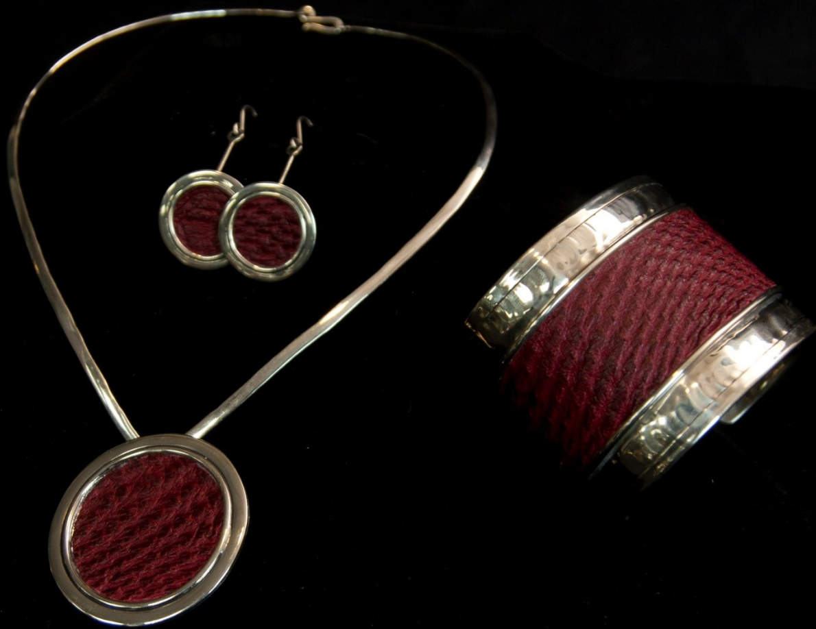
Set de joyería en plata y piel de Ñandú de León Sartori para Manos del Uruguay