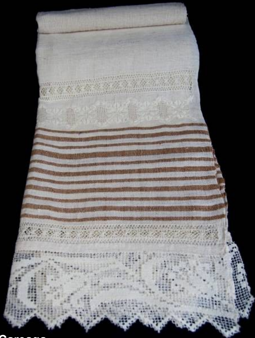
Toalla social de lienzo" de Arminda Careaga