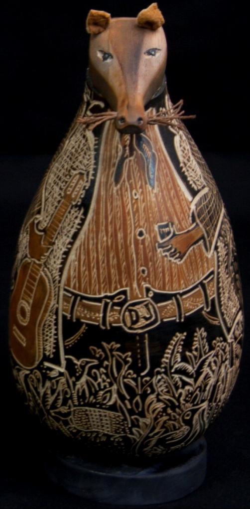
Set de piezas ornamentales en calabaza de Pedro Garcia