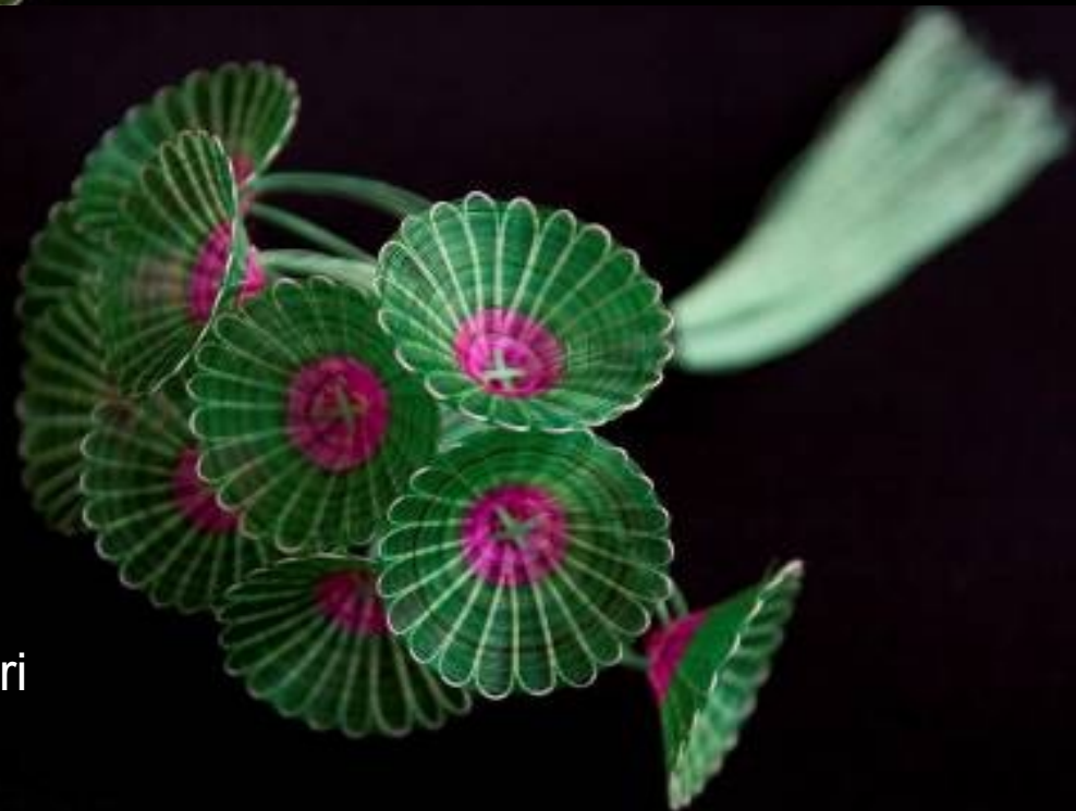
Artesanía en Crin de la Asociación Maestra Madre de Rari