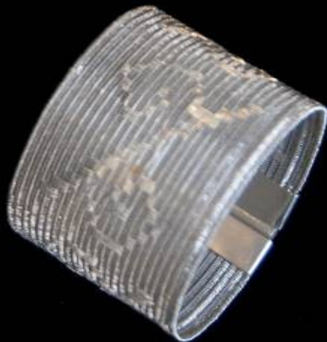
Pulseras tejidas en plata de Lilia Breyter