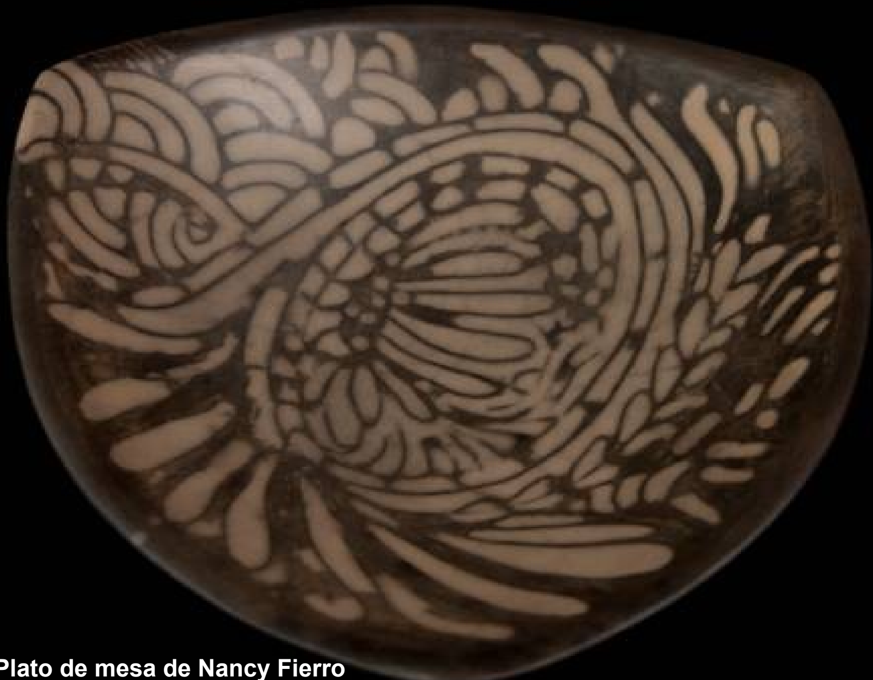
"Plato de mesa de Nancy Fierro