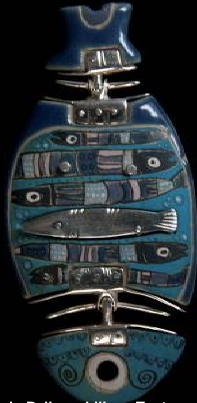
Juego de tres piezas en gres cerámico y plata de Marcelo Pallas y Liliana Testa