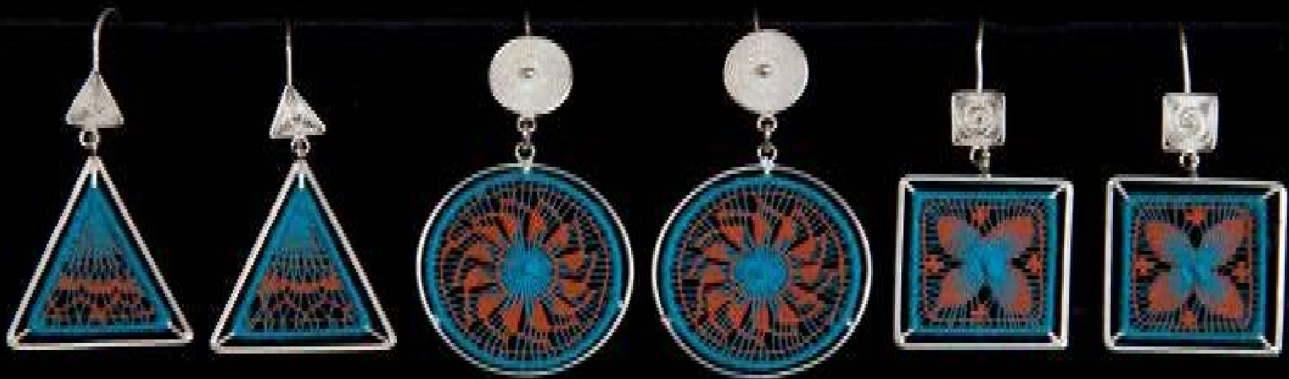
Aros de ñanduti con filigrana en plata" de Estación A