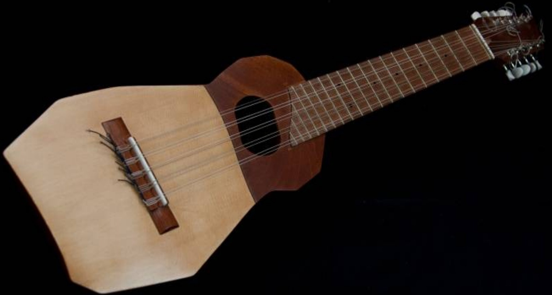
Ronroco de Javier Carvajal Fuic