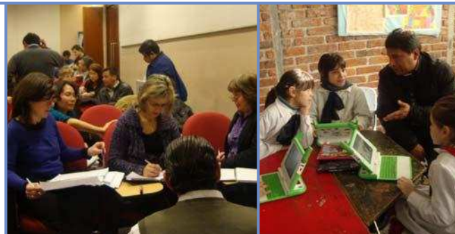
Indicadores sobre el Desempeño en el Proceso de Desarrollo de Capacidades

“La importancia de pensar las reformas y abordajes curriculares con una mirada sistémica, que integre niveles macro, meso y micro, a la vez que articule políticas curriculares y educativas.” -participante