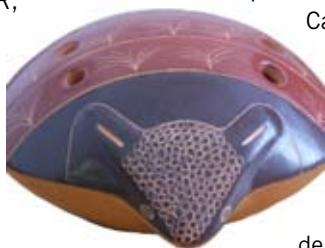
"Ocarina Quirquincho" realizada por Sergio García Farina (Chile) Reconocimiento de Excelencia 2008.

Los contenidos impartidos fueron una adaptación del Módulo 3: Gestión de riesgos en el Patrimonio, elaborado por el Centro del Patrimonio Mundial para el