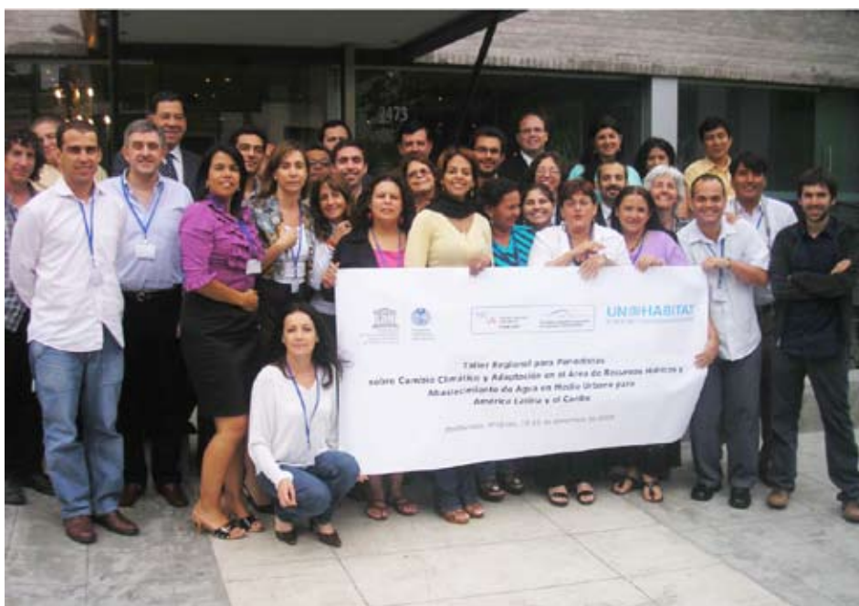
Participantes del Taller Regional de Periodistas