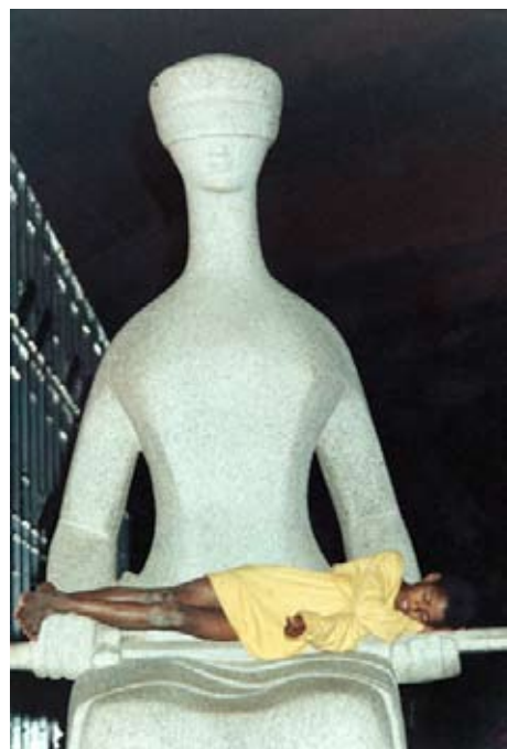
Supremo Tribunal Federal, Brasil, 1998.

(Santo Domingo, República Dominicana, 4 al 11 de diciembre de 2009) El Programa MOST de UNESCO, en asociación con la Fundación Global Democracia y Desarrollo (FUNGLODE, República Dominicana), el Centro Latinoamericano de Economía Humana (CLAEH, Uruguay) y el Consejo Latinoamericano de Ciencias Sociales (CLACSO), llevaron a cabo la III edición de la Escuela Regional para jóvenes investigadores de América Latina y el Caribe (“Nexo entre Ciencias Sociales y Políticas. Políticas de desarrollo social en tiempos de crisis.”) Se trata de la continuación de un programa de Escuelas Regionales itinerantes coordinado por el CLAEH y que tuvo su primera edición en el año 2003 (Punta del Este, Uruguay) y continuó en 2007 (Salvador de Bahía, Brasil). En las tres ediciones realizadas hasta el momento, a través de este programa se ha capacitado más de un centenar de jóvenes profesionales provenientes de 15 países de América Latina y el Caribe, representando a cerca de 50 universidades de la región. En la tercera edición, se incluyó un cupo de participantes reservado a responsables de políticas, significando