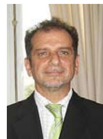
POR JORGE GRANDI DIRECTOR

V arias voces señalan que la cooperación internacional sólo debería concentrarse en los países y regiones de bajos ingresos; en contraposición se encuentran posturas que sostienen que todos los países en vías de desarrollo deben ser tenidos en cuenta como naciones receptoras de cooperación internacional.