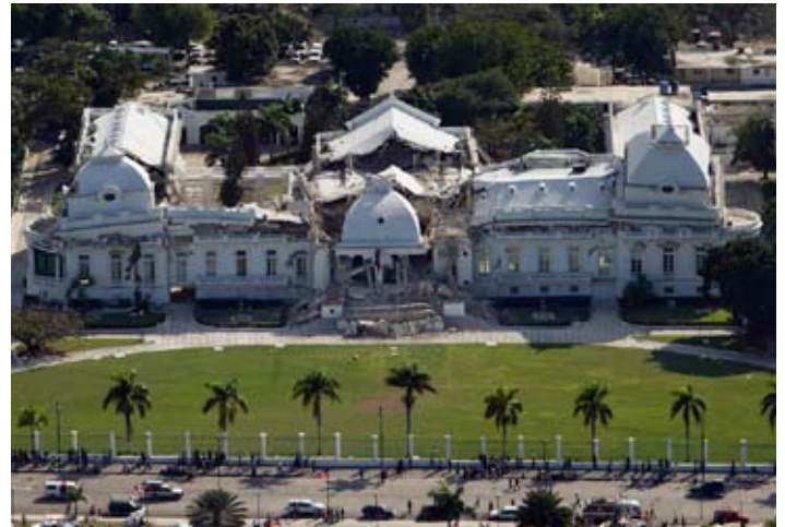
El Palacio Nacional de Haití luego del terremoto del 12 de enero de 2010.

sufrido traumas graves. [...] La UNESCO también contribuirá a la realización de reparaciones urgentes y prestará ayuda a la enseñanza secundaria y superior. Asesorará a las autoridades haitianas para efectuar una evaluación de los daños sufridos por las instalaciones de los centros docentes de esos dos niveles de enseñanza y determinar cuáles son las necesidades más urgentes. También ayudará al Ministerio de Educación a preparar un plan básico para la reanudación rápida de los cursos. De las 1.500 escuelas inspeccionadas hasta la fecha en las zonas más duramente azotadas por el terremoto, solamente 85 no han tenido que deplorar daños graves. [...] La UNESCO ha hecho extensiva su ayuda de emergencia a las autoridades de la educación nacional, proporcionándoles equipamientos básicos y locales de trabajo provisionales, a raíz del desmoronamiento del edificio del Ministerio de Educación. La Organización va a impartir formación básica a los funcionarios de ese ministerio sobre planificación y gestión de respuestas de emergencia. Además de la educación, la UNESCO está centrando su atención en proyectos destinados a salvaguardar la riqueza cultural del país: bienes culturales, objetos de artesanía y elementos del patrimonio inmaterial, así como monumentos, museos, bibliotecas y archivos. La Organización está evaluando los daños infligidos al patrimonio cultural y está impulsando una movilización para prevenir los riesgos