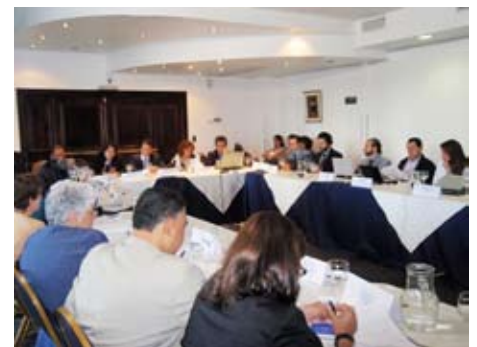
Los participantes en sesión de trabajo durante el Taller.

ser tratados desde un enfoque regional; b) Analizar iniciativas ICAM actuales en respuesta a los temas prioritarios identificados a nivel nacional y regional, en términos de capacidad, conocimiento, comunicación, redes/ asociaciones; c) Explorar el estado del conocimiento y posibles brechas existentes en cada país con relación a los impactos del cambio climático en estas cuestiones compartidas; d) Identificar brechas existentes y necesidades específicas que requieran consideración para el mejoramiento de los esfuerzos actuales de ICAM, nacionales y regionales, de adaptación al impacto del cambio climático en temas de común interés; e) Formular los objetivos de Proyecto Regional;