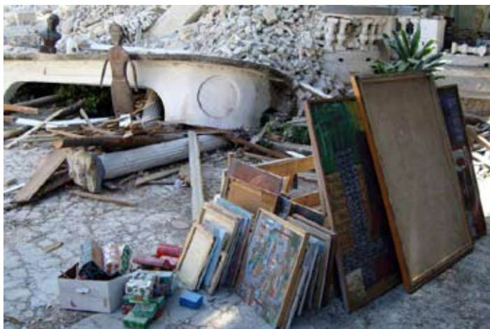
(izq.) © UNESCO/Fernando Brugman, National Art Center, Port-au-Prince, Haití.