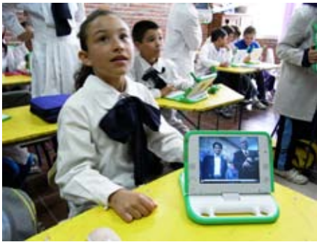
Escuela primaria en Montevideo, alumnos muestran sus computadoras portátiles XO