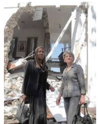
(der.) © UNESCO/FW Russell-Rivoallan, 2010, Marie-Laurence Jocelyn Lassègue, ministra de Cultura de Haití, e Irina Bokova, Directora General de la UNESCO, frente al ministerio de Cultura de Haití, en ruinas.