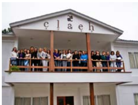
Participantes del Curso-Taller para Educadores desde el nacimiento hasta los 5 años que tuvo lugar en Punta del Este, Uruguay

El Sector de Educación de UNESCO Montevideo con su Programa Punto de Encuentro, y el Comité uruguayo de O.M.E.P (Organización Mundial de Educación Preescolar), con la colaboración