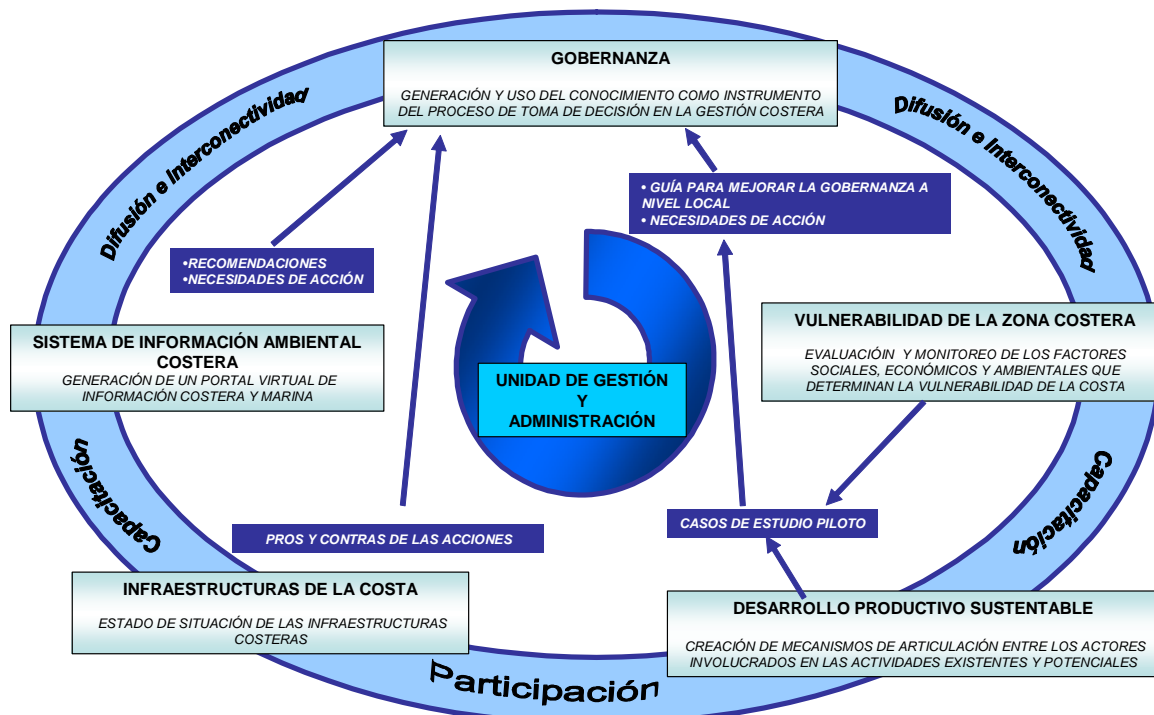
Figura 3.- Sinopsis del Programa EcoPlata. Áreas Temáticas, Vinculación y Acciones Prioritarias.

En base a estos lineamientos y los problemas percibidos por los gestores y actores vinculados a la GIZC, EcoPlata plantea cinco Áreas Temáticas (AT) a ser implementadas durante esta nueva Fase. Las Áreas identificadas son, Gobernanza, Vulnerabilidad de la Zona Costera, Desarrollo Productivo Sustentable, Infraestructuras Costeras y Sistema de Información Ambiental Costera cuyos principales objetivos se detallan en la Fig. 3.