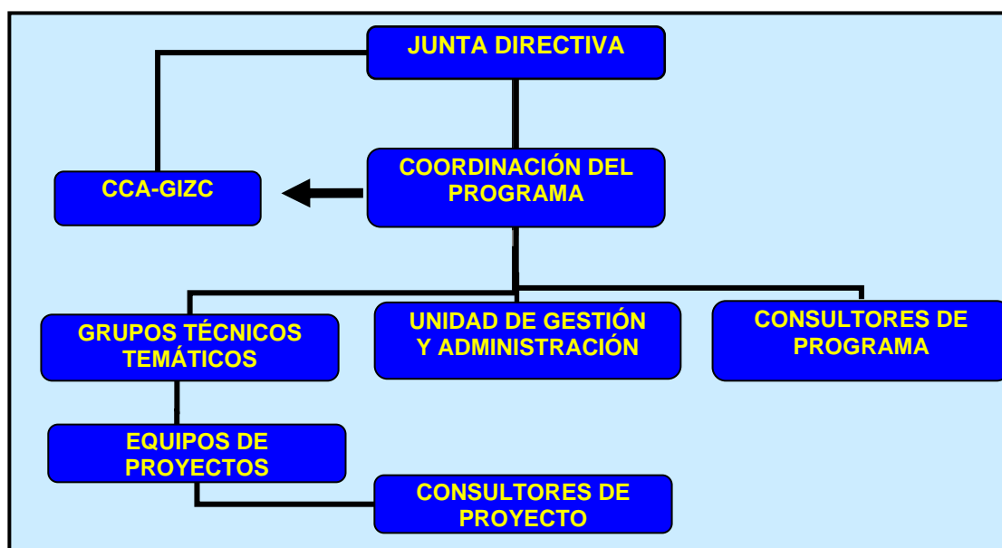
Figura 1.- Organigrama del Programa EcoPlata

El Programa EcoPlata es gestionado a través de la Unidad de Gestión y Administración. A través del CIID se ha venido contando también con la cooperación de instituciones canadienses como las Universidades de Dalhousie y Acadia, con el Instituto de Bedford y con el Ministerio de Medioambiente Canadiense (Environment Canada).